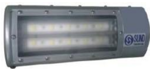
付属光源ユニット (6.3W)